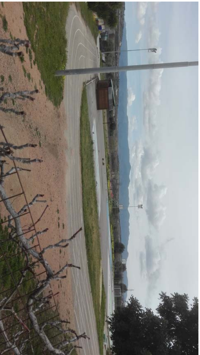
VISTA 4 – DALLA STRADA TENNIS CLUB