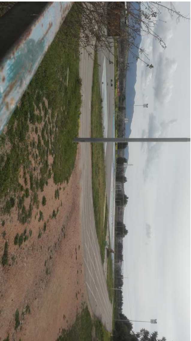
VISTA 1 - DALL'INGRESSO ALL'IMPIANTO