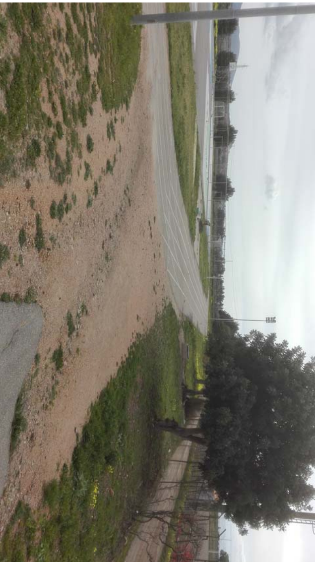
VISTA 2 - DALL'INGRESSO ALL'IMPIANTO