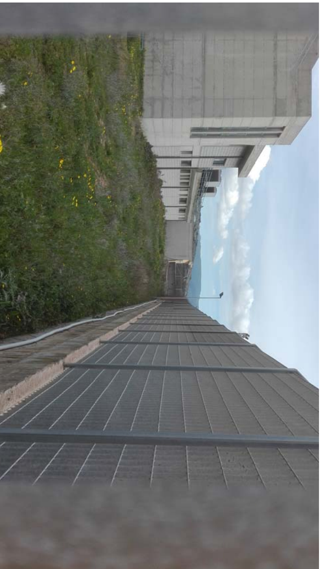
VISTA 3 – ADIACENZA CON IL PALAZZETTO (VISTA LOCALE MAGAZZINO)